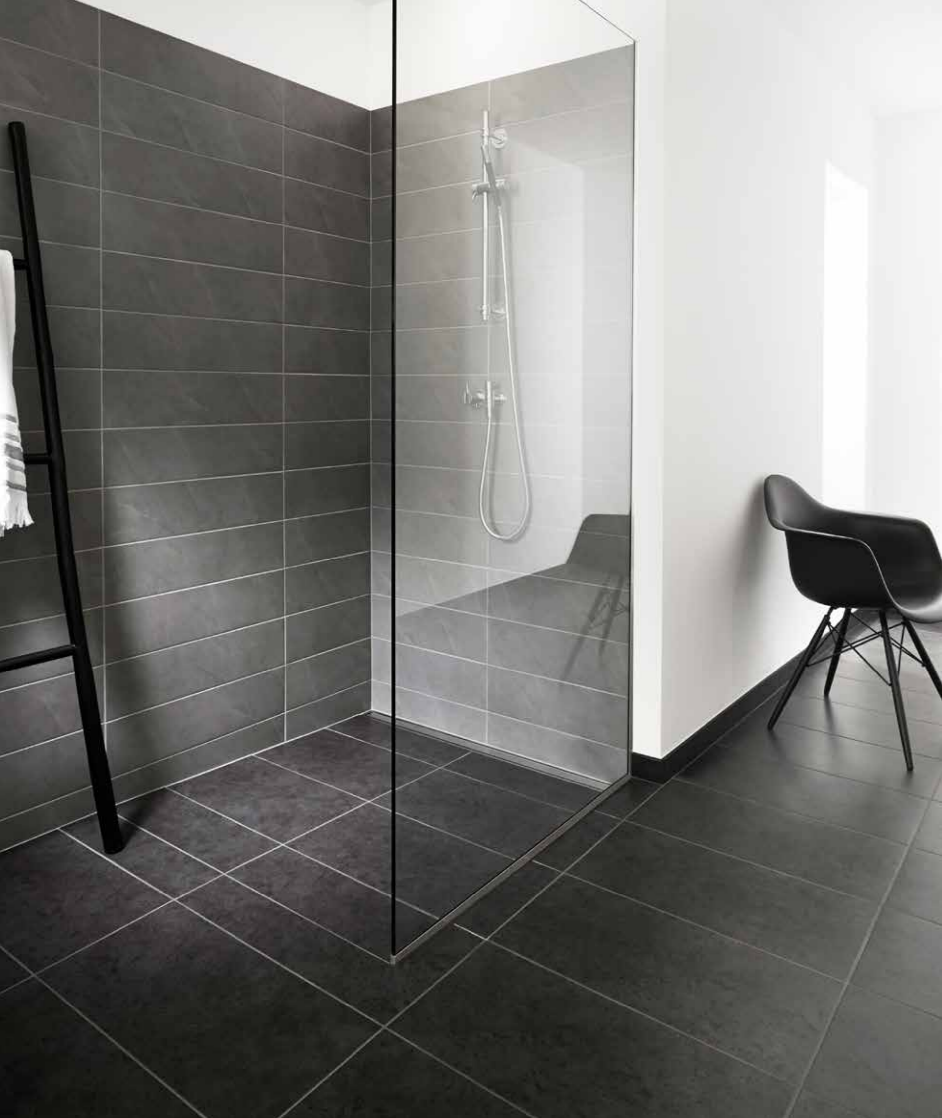
Sprchová stěna GlassLine | Transparentní Podlahový odtok HighLine | Panel s rámečkem