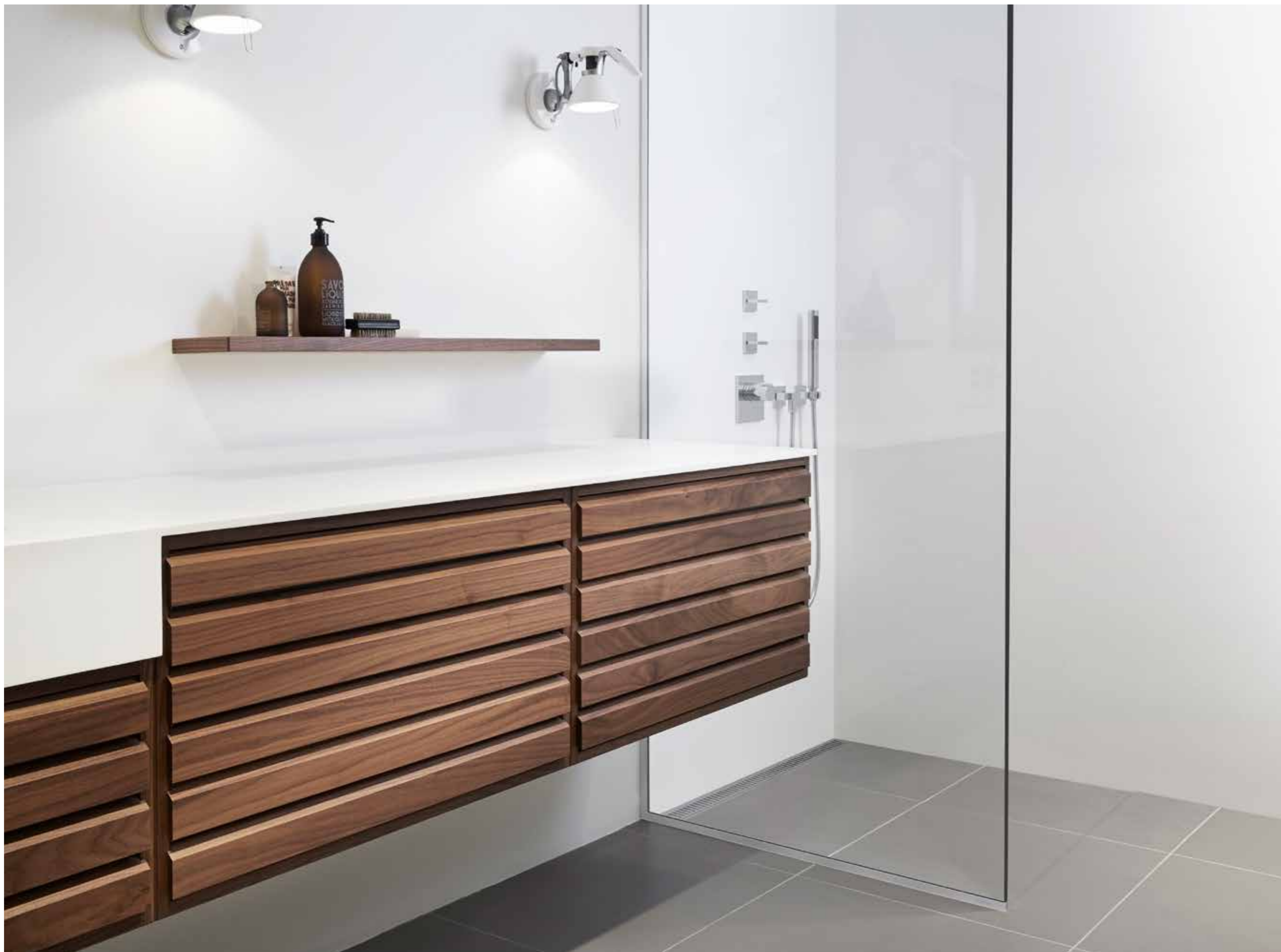
Sprchová stěna GlassLine | Transparentní Podlahový odtok ClassicLine | Column