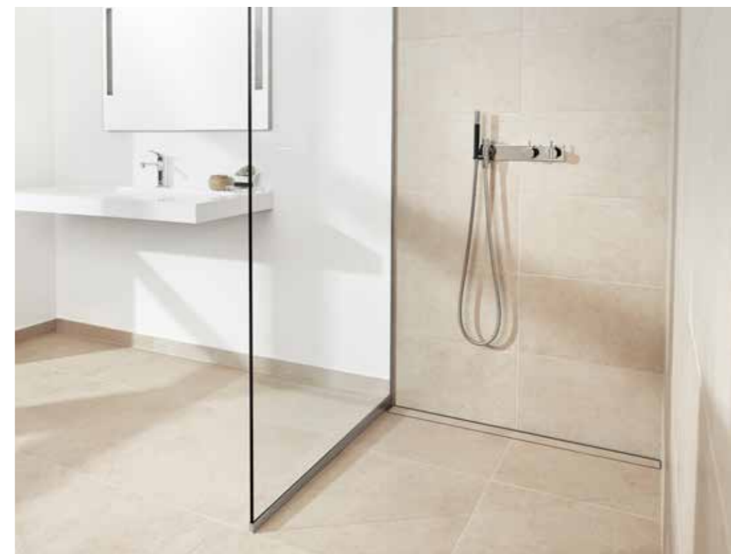
Sprchová stěna GlassLine | Transparentní Podlahový odtok HighLine | Vlastní