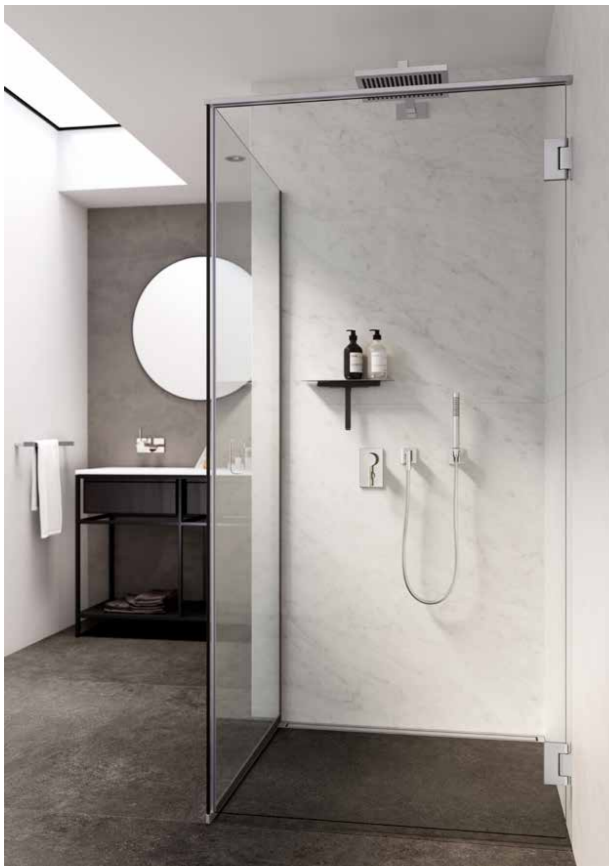
Sprchové dveře GlassLine, horní kolejnice | Ocel Podlahový odtok HighLine | Panel s rámečkem